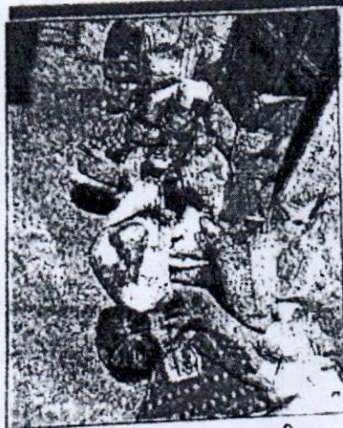
लाभुकों ने लीटाई पोषाहार सामग्री।

क्या है मामला: भारतीय महिला संघ ने गर्भवती और धातु बच्चियों को पोषाहार सामग्री उपलब्ध कराने का जिम्मा रोजगार ग्राम संगठन पेटरवार को दिया है। चयनित दुकान से सामान लेकर आंगनबाड़ी केंद्र की सेविकाओं के माध्यम से यह सामग्री बांटी जाती है। केंद्र में बुलाकर पोषाहार सामग्री लाभुकों को दी जाती है। सोमवार को रोजगार ग्राम संगठन से जुड़ी महिलाओं ने चावल, दाल और गुड़ टेंट हाउस के गंदे कपड़े में एक पोटली बनाकर पेटरवार की आंगनबाड़ी केंद्र में पहुंचा दिया। जहां